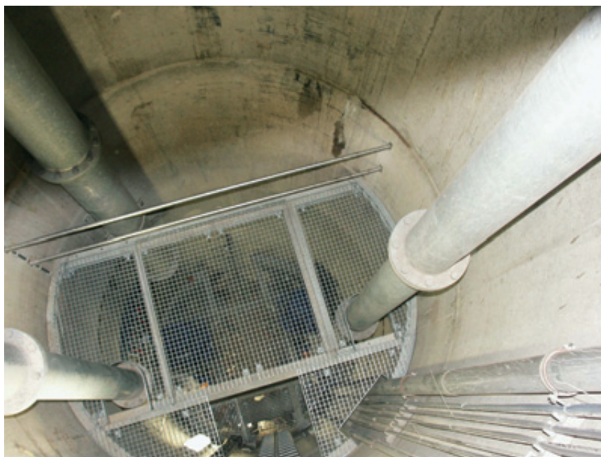
Abb. 3 Blick in den Schacht mit eingebauter Zwischenbühne

Die Herstellung des Schachtes und der Stränge ist ein Spezialverfahren und wurde von der BHG Brechtel GmbH