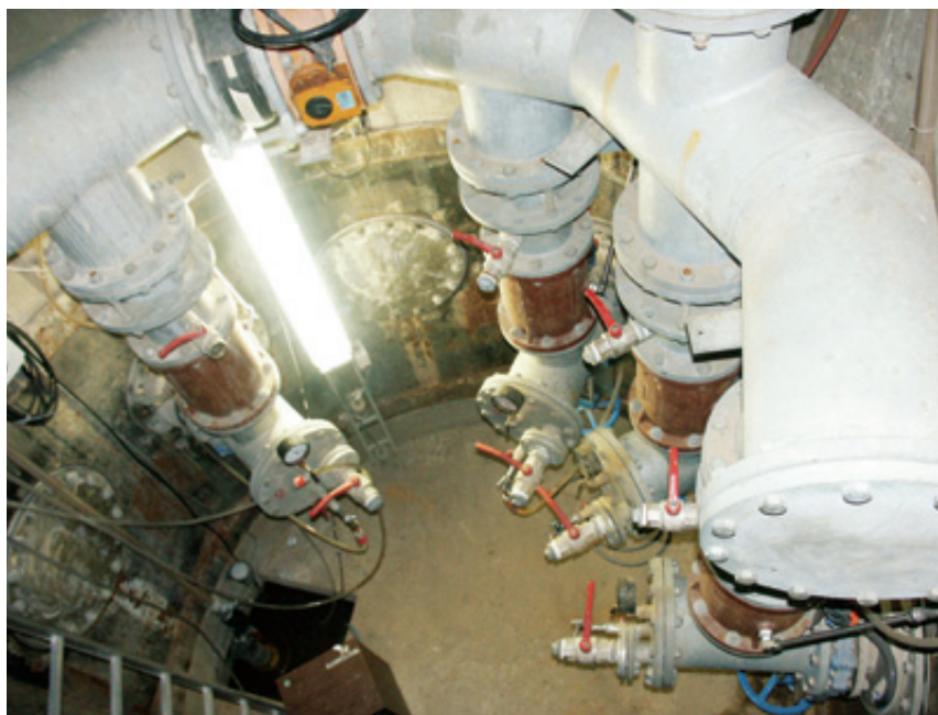
Abb. 4 Innenausbau des Horizontalfilterbrunnens in Trockenaufstellung

ausgeführt. Zuerst wurden starkwandige Betonrohre als Betonfertigteilringe nach DIN 4035 (Innendurchmesser 2,8 m) in den Untergrund bis ca. 17 Meter zur Herstellung des Brunnenschachtes abgeteuft. Nach dem Erreichen der geforderten Endteufe wurde der Schacht mit einer Unterwasserbetonsole abgedichtet, woraufhin der Schacht leergepumpt werden konnte. Im Folgenden wurde in der vorher festgelegten Tiefe das Bohrgerät installiert und durch die eingebauten Schachtwanddurchführungen die Stränge erstellt ( Abb. 4 ).